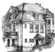
Ibero Club Bonn e.V.