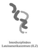
Interdisziplinäres Lateinamerikazentrum (ILZ)